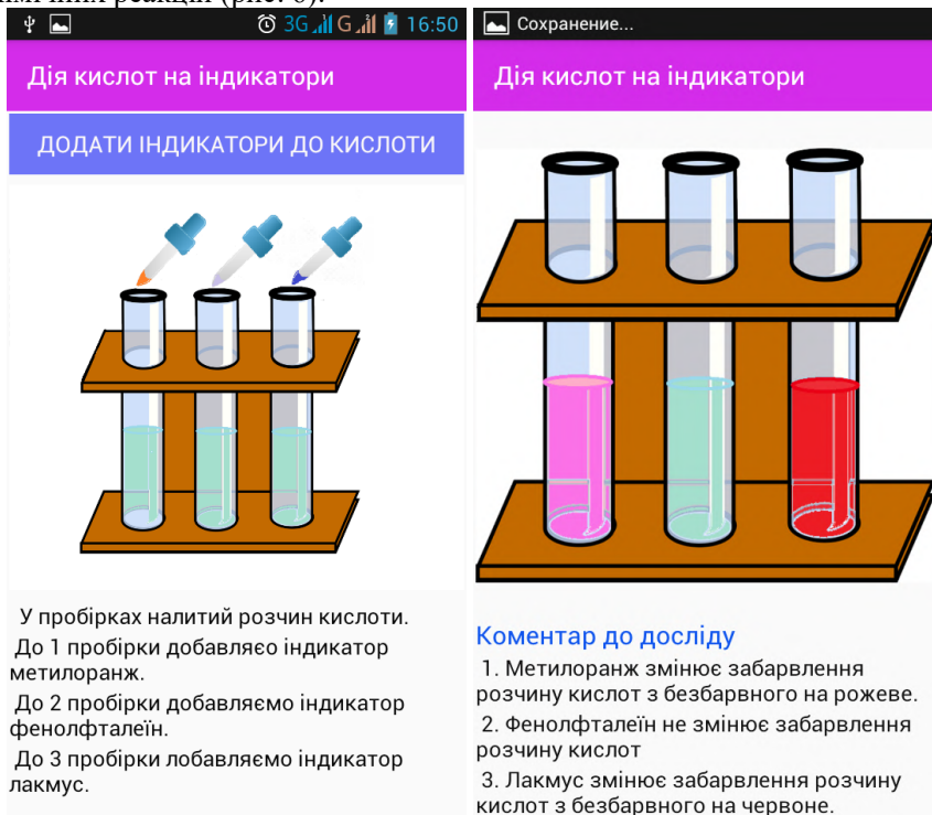
Рис. 6. Вигляд форм дослідів «Дія кислот на індикатори»

Вона призначена для демонстрації хімічних дослідів, які вивчаються в шкільному курсі неорганічної хімії. У додатку змодельовано наступні хімічні досліди: «Дія водних розчинів лугів на індикатори», «Взаємодія хлоридної кислоти з металами», «Дія водних розчинів кислот на індикатори», «Взаємодія лугів із кислотами в розчині». Даний розділ має допомогти учням у розумінні хімічних процесів, які відбуваються під час хімічних реакцій (рис. 6).